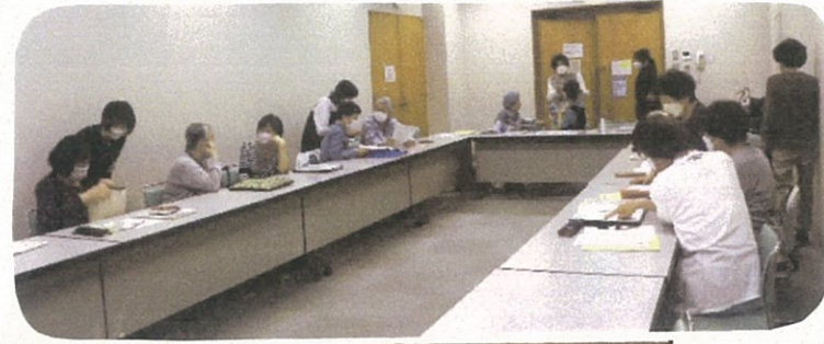
定例会で各班がメニューの打合せ