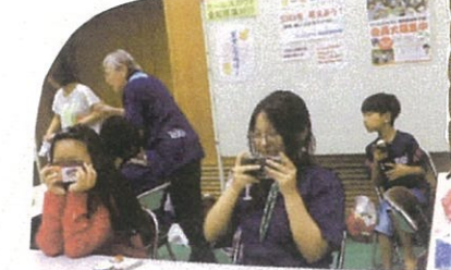
地球にやさしいエコバスケット作り