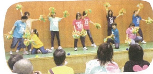
歌謡 落語 日本舞踊 ダンス 手話コーラス ゴスペル フラダンス