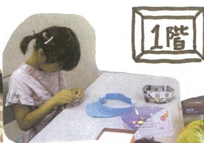
サンバイザーを作ろう!