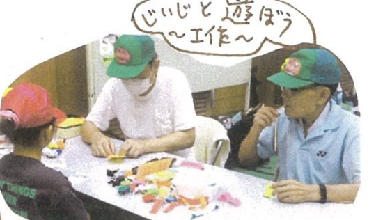
じいじと遊ぼう～工作～