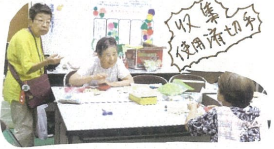
収集済み使用済切手