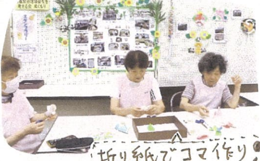
折り紙でコマ作り