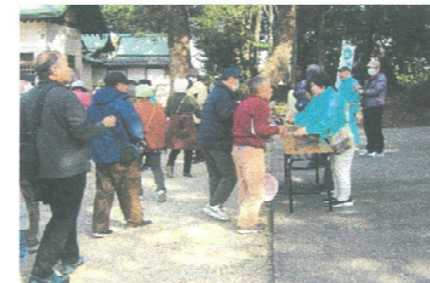
一之御前神社検印