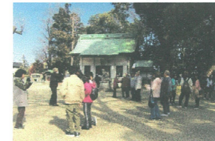
一之御前神社休憩