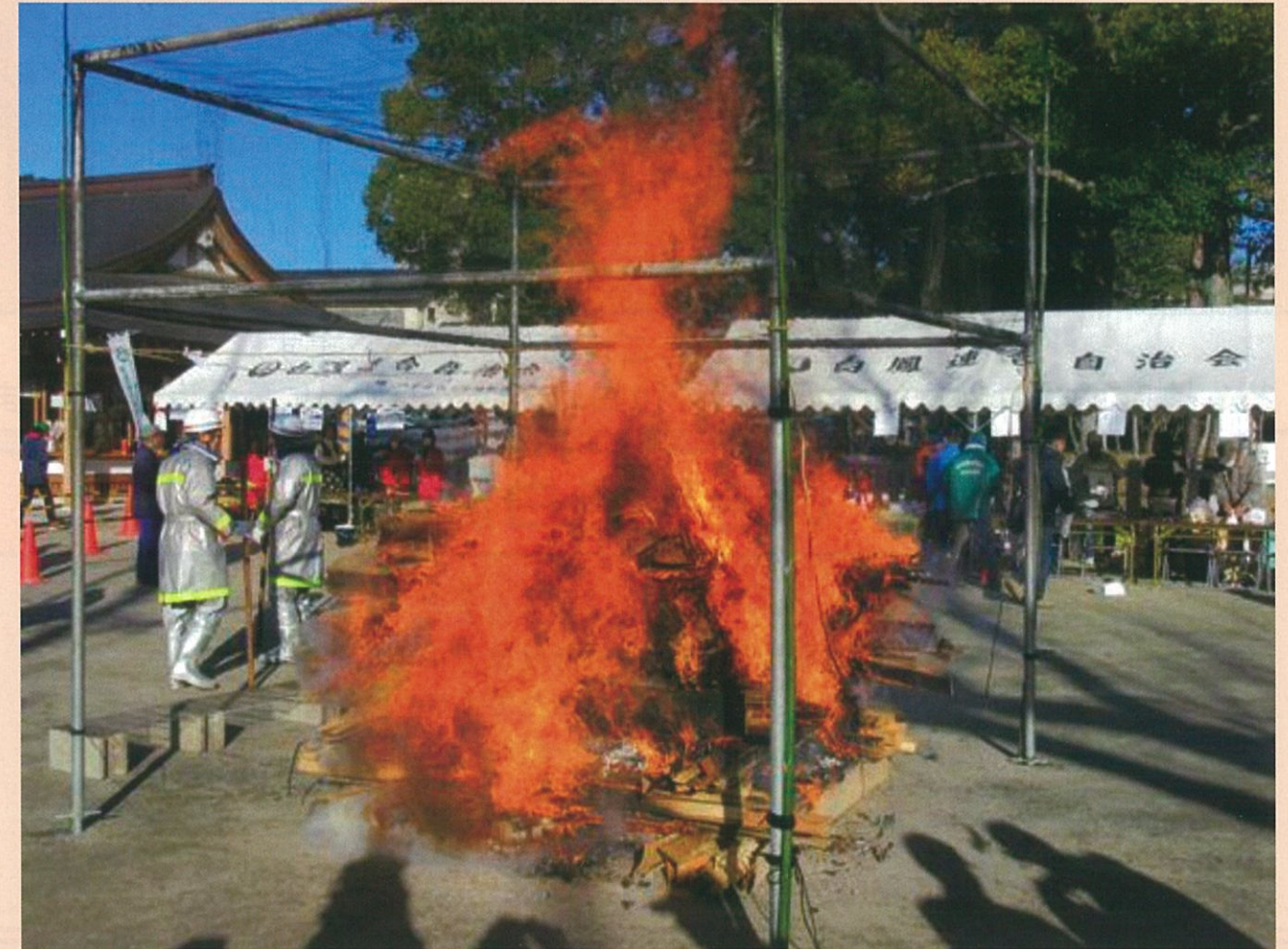
澁川神社でのどんど焼きの様子