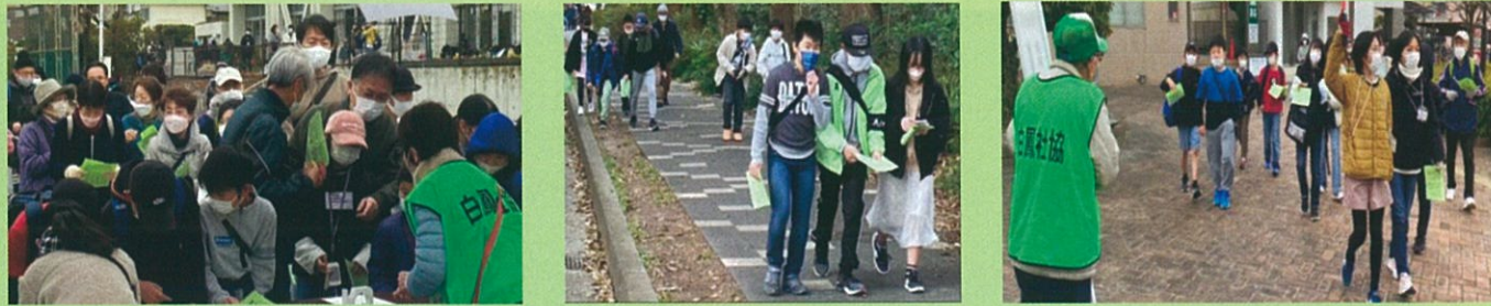
写真は令和5年3月5日のウォーキング in 白鳳の様子