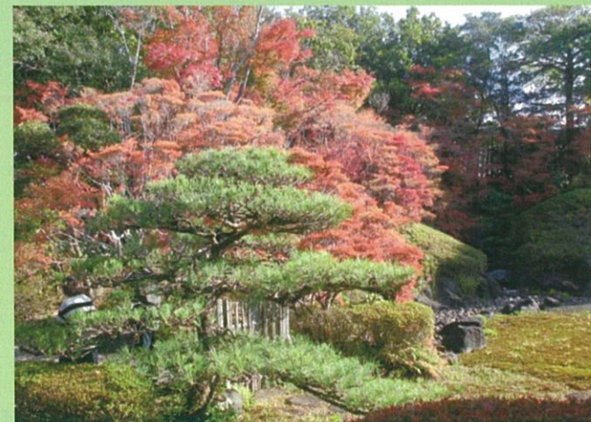
どうだん亭 (11月19日撮影)