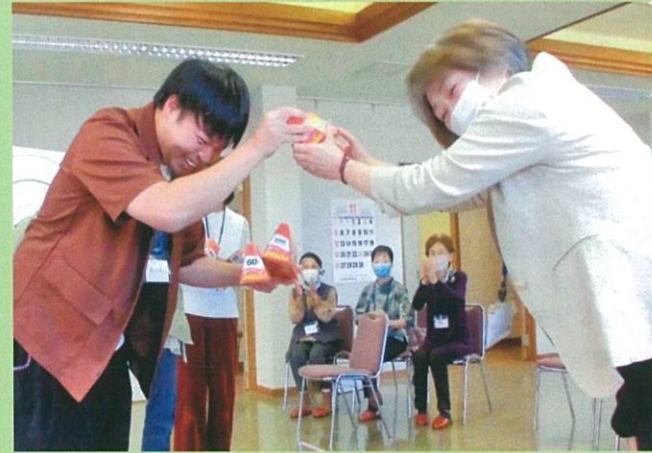
いきいき白鳳の様子