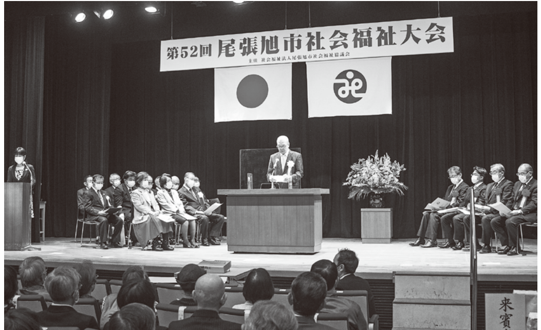
▲▼第52回尾張旭市社会福祉大会の様子