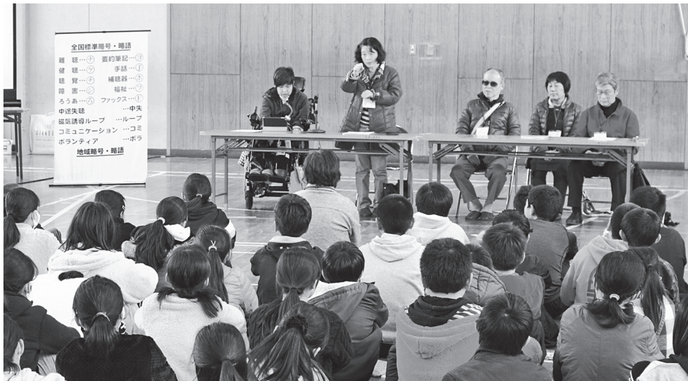
▲会費を財源に実施する市内小学校での「児童・生徒の福祉実践教室」