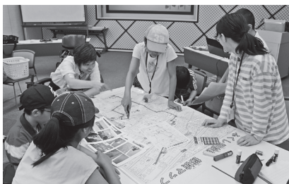
▲みんなでふくしマップ作り

社会福祉協議会では、市内在住の小学5・6年生を対象に、「ふくし」について学ぶ福祉教育講座を開催します。