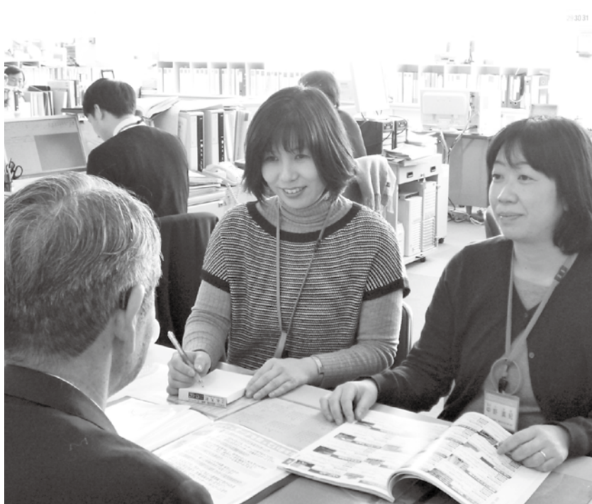
▲専門職が親身になって相談に応じます。

・電話相談 ・訪問相談 ・来所相談 ・eメールによる相談等 ※相談に関する秘密は厳守しますのでご安心ください。