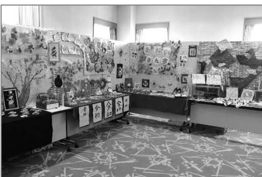
令和元年度高齢者施設 パネル展示の様子